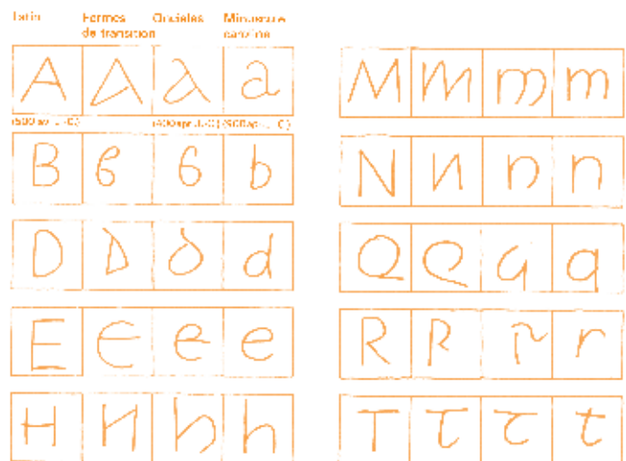
Comment les majuscules sont devenues des minuscules grâce à l'écriture cursive

reconnues comme des minuscules (issues respectivement de l'ancienne et nouvelle cursive romaine) mélangées à d'autres identifiées comme capitales – par exemple, le « n » demi-oncial garde la forme capitale composée par deux traits verticaux et un trait diagonal en leur milieu.