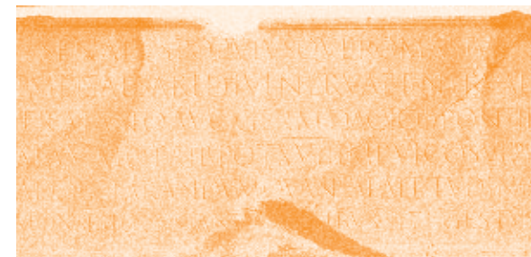
[a] Inscription en Capitalis Monumentalis sur la base de la Colonne Trajane.

Ces lettres étaient d'abord peintes puis sculptées; les gestes du sculpteur suivaient les lignes tracées au pinceau. Cette manière de faire explique en partie pourquoi le trait gravé préserve le mouvement organique de la main [2]. Pour la confection de manuscrits prestigieux, d'autres capitales, influencées directement par la Capitalis Monumentalis , étaient utilisées; la plume étant préférée au pinceau. En parallèle, l'écriture cursive romaine s'est développée grâce notamment à la correspondance épistolaire quotidienne. Cette dernière écriture contenait déjà quelques archétypes des signes qui, avec l'évolution de l'alphabet latin vers la bicaméralité – c'est-à-dire la distinction entre les lettres majuscules et les minuscules dans un même alphabet –, font partie du squelette commun des lettres minuscules utilisées aujourd'hui.