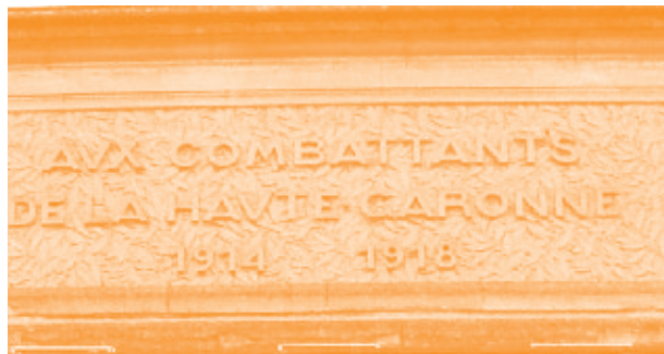
[a] Détail du Monument aux Combattants de la Haute-Garonne, à Toulouse 2008 (disponible sur www.panoramio.com ) © Jefferson Wellano

Cette connexion avec le passé nous amène à penser à l'origine de nos institutions, et suscite parfois des critiques. Des typographes modernistes comme Herbert Bayer (artiste ayant étudié et enseigné au Bauhaus) [e] et Jan Tschichold (graphiste et typographe très influent) ont proposé d'abolir les capitales pour l'unicaméralité minuscule ; cette pensée fonctionnelle met en valeur l'économie de temps et les ressources qui en résulterait ainsi que l'esthétique :