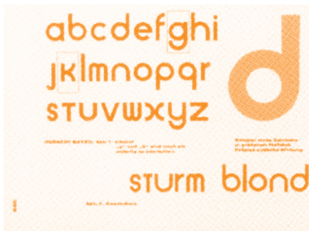
[e] Caractère Universal, de Herbert Bayer, créé entre 1925 & 1926, ce caractère ne contient que des minuscules. © Roxanne Jubert, Graphisme, typographie, histoire , Éditions Flammarion, 2005, Paris.

Cette connexion avec le passé nous amène à penser à l'origine de nos institutions, et suscite parfois des critiques. Des typographes modernistes comme Herbert Bayer (artiste ayant étudié et enseigné au Bauhaus) [e] et Jan Tschichold (graphiste et typographe très influent) ont proposé d'abolir les capitales pour l'unicaméralité minuscule ; cette pensée fonctionnelle met en valeur l'économie de temps et les ressources qui en résulterait ainsi que l'esthétique :